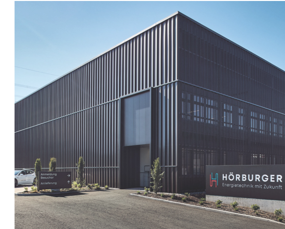
Neue Fertigungshalle am Römergrund in Rankweil.

Aluminium – geschweißt Ausführung: Dichtheitsklasse C und D gemäß DIN EN 1507.