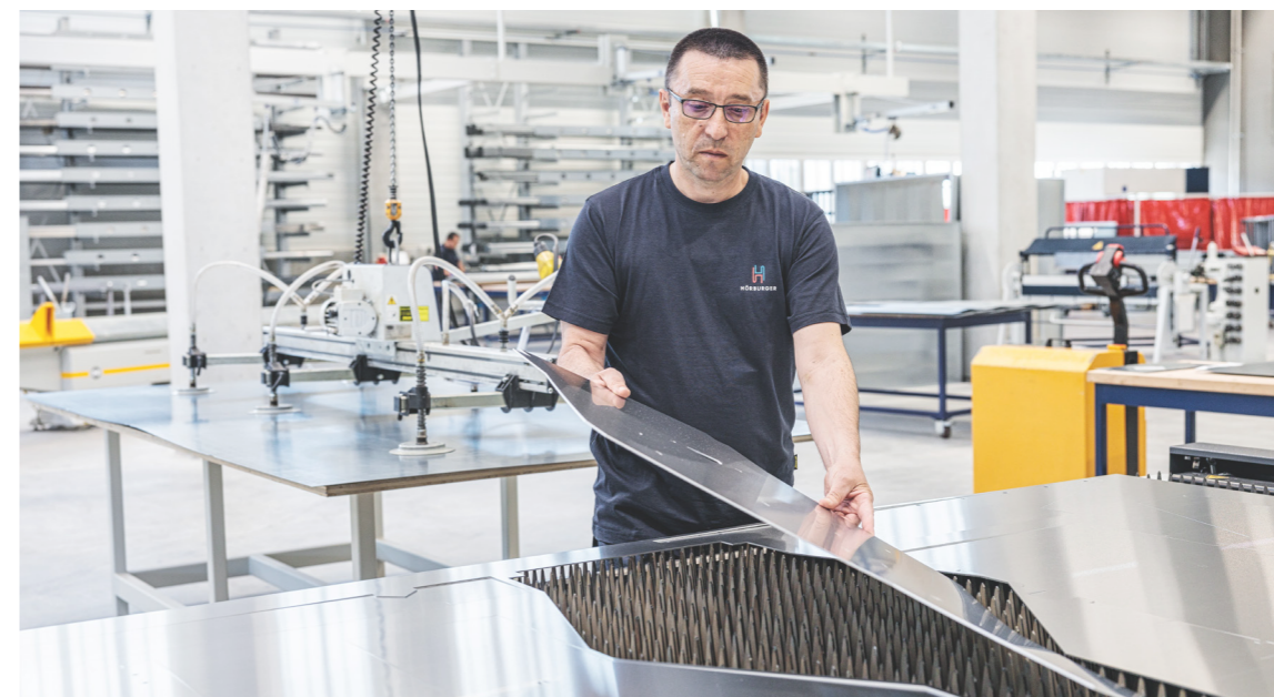
Top-ausgebildete Mitarbeiter und ein moderner Maschinenpark sorgen für einen optimalen Betrieb.