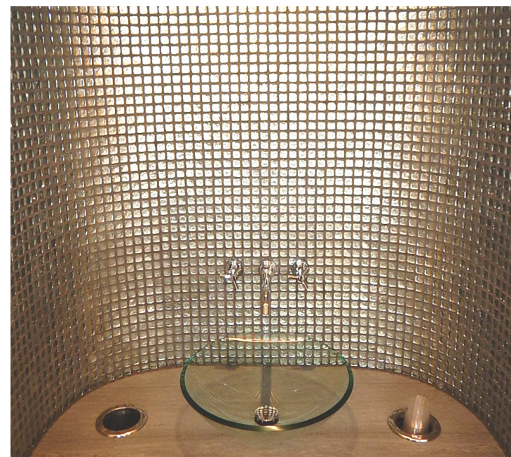
Design trifft auf Komfort.