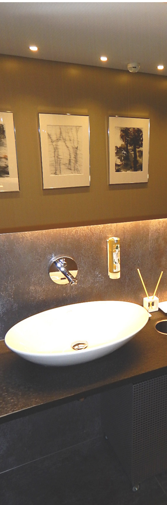
Eleganz in den neuen Bädern.