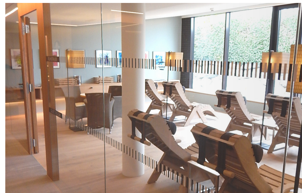
Blick in den neuen Ruheaum.