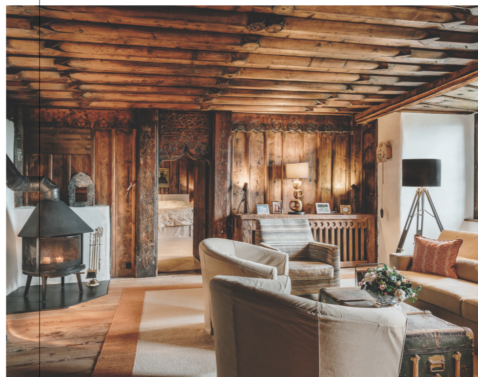
Schickes Setting mit viel Platz und Raum.