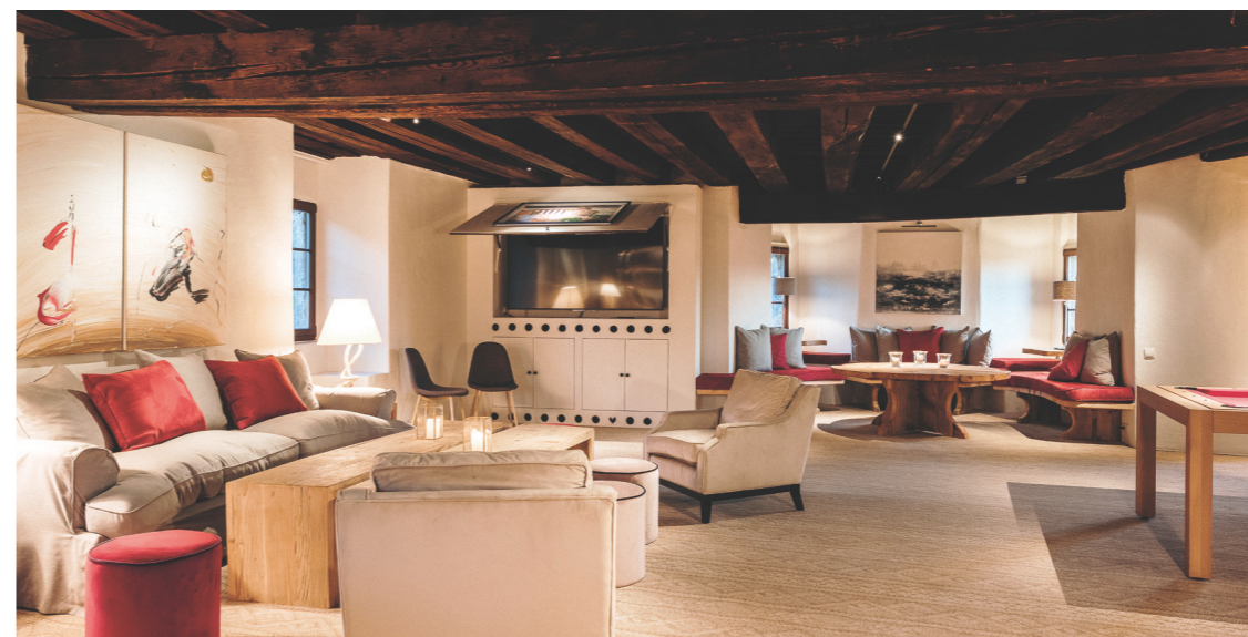
Der alte Bestand glänzt in neuem Kleid.

Die energietechnischen Umbauarbeiten dauerten insgesamt 13 Monate. Dann war es geschafft: Heute reichen sich Geschichte und Luxus die Hände, Gotik trifft auf Moderne und verschmilzt zu einem einmaligen Wohlfühl-Ambiente.