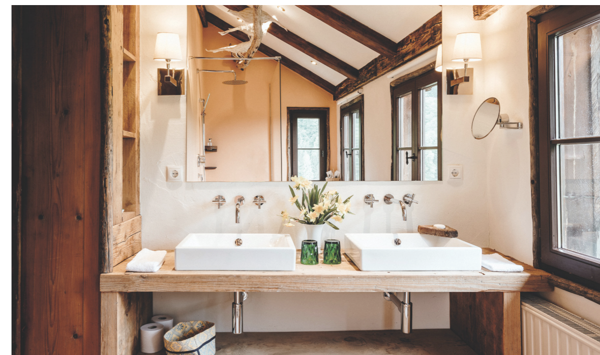
Zeitgemäßes Bad mit einem Hauch von Luxus.